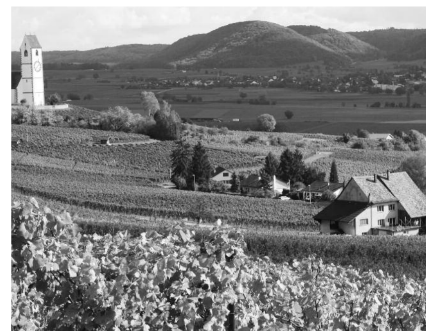
Die Hotelzone um das Oberwiesenhaus (rechts).

An der Herbst-Klausursitzung vom 28. Oktober 2011 wird der Gemein-